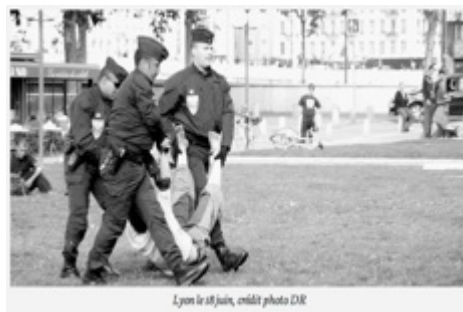
Lyon le 14 juin

Le 29 mai : http://www.youtube.com/watch?v=cygEVXzhnnU